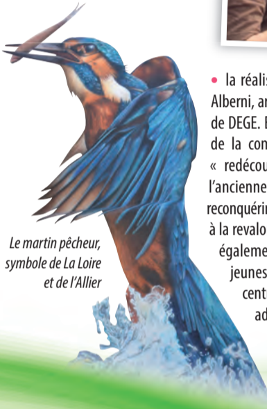
Le martin pêcheur, symbole de La Loire et de l'Allier