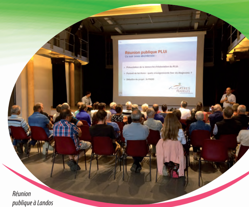
Réunion publique à Landos

Ce projet de développement a pour vocation de construire un territoire cohérent et attractif qui tienne compte des spécificités de chaque commune. Une fois approuvé, le PLUi remplacera les Plans Locaux d'Urbanisme communaux, les cartes communales et le Règlement National d'Urbanisme. Le PLUi doit être compatible avec les documents de « rang supérieur » dont le SCoT du Velay.