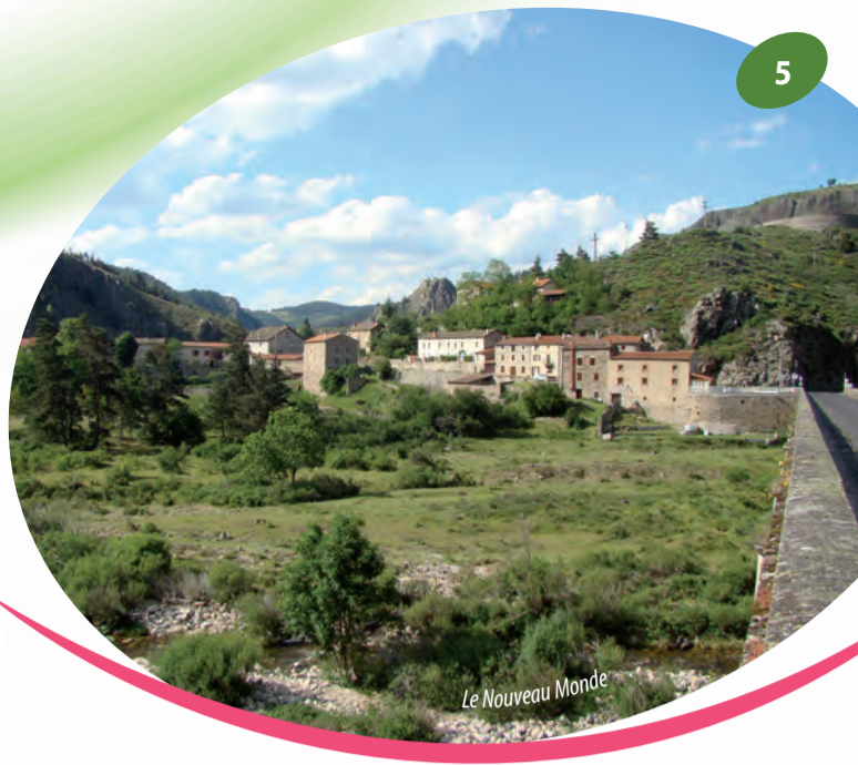
Le Nouveau Monde