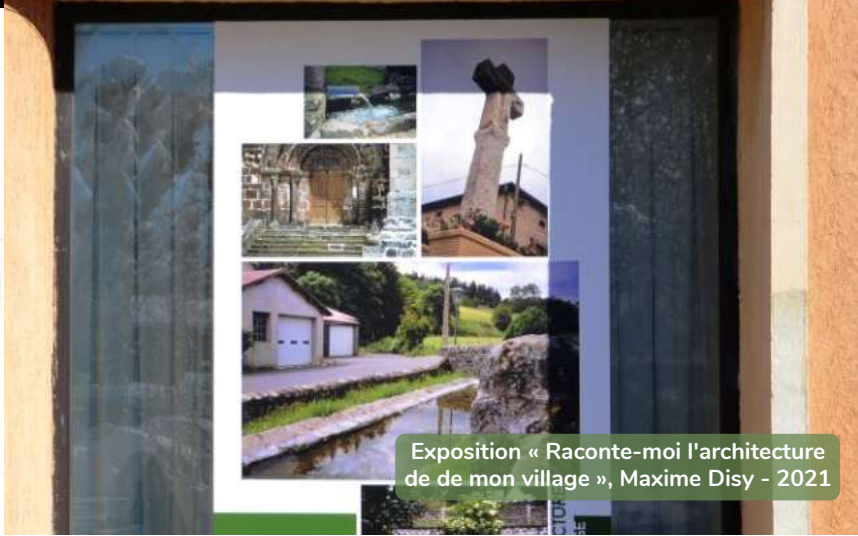
Exposition « Raconte-moi l'architecture de mon village », Maxime Disy - 2021